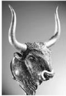
Ο ΤΑΥΡΟΣ λατρευόταν από τους Μινωίτες.