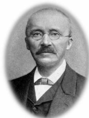
Ερρίκος Σλήμαν Ανακάλυψε τις Μυκήνες.